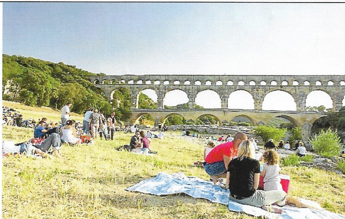
En avril, le Pont du Gard fête Pâques à l'occasion du treizième rendez-vous de "Garrigue en fête". Au programme de ces deux journées : des rencontres artistiques, culturelles et gustatives à savourer seul, en couple ou en famille.

A l'occasion du 30e anniversaire de l'inscription du Pont du Gard au Patrimoine mondial de l'Unesco, le site propose jusqu'à la fin de l'année concerts, cirque, théâtre, animations et expositions sous le parrainage du photo-reporter Édouard Elias.