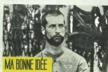
MA BONNE IDÉE