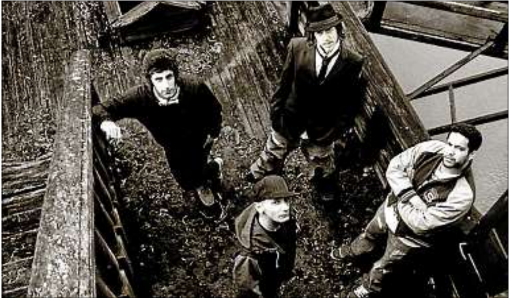
■ Les épouvantails toulousains joueront leur dernier album, Devil & crossroads .

● NOCTURNE Visitez de nuit, Villeneuve-lès-Avignon. Du quartier de la Tour au mont Andaon en passant par le centre historique de la cité, laissez vous conduire par une guide conférencière qui vous contera son Histoire. Contact : 04 90 25 61 33.